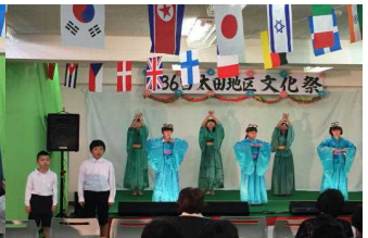
3年生・5年生が参加 雨晴音頭、帆柱起こし祝い唄、よっちょれ、つまの舞を披露しました。