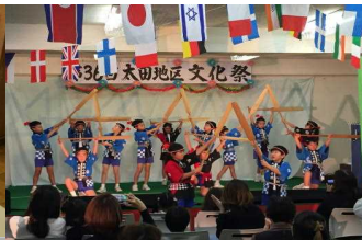
太田地区文化祭 (11/3) 3年生・5年生が参加 雨晴音頭、帆柱起こし祝い唄、よっちょれ、つまの舞を披露しました。