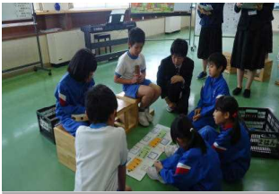
県西部音楽科部会研究会 (11/6) 本校は H30・31 年度の研究指定校 参加した先生方から、児童が生き生きと活動していた、素晴らしい授業・取組であったという非常に高い評価をいただきました。