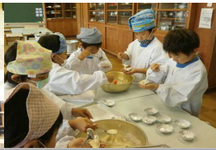
1・2年生つまいもパーティー (10/29) 保育園のみなさんをおもてなし。