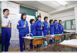
本校は H30・31 年度の研究指定校 参加した先生方から、児童が生き生きと活動していた、素晴らしい授業・取組であったという非常に高い評価をいただきました。