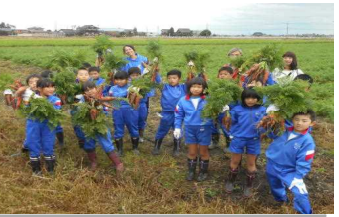
3年校外学習 (11/13) スタファームにて人参の収穫体験をしました。