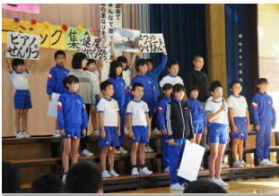
ハッピーミュージック集会 (10/23) 日増しに楽しめるようになってきています。